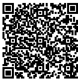
ZAKIE MUNANDA Ketua TUK